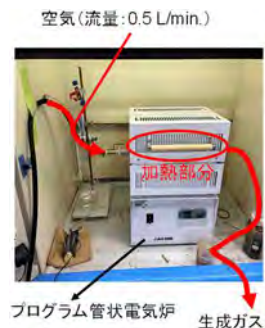
図1 UCG 模擬実験

図1にUCG模擬実験の配置図を示す。粒径1~2mmに破碎した瀝青炭30gをステンレス製炉心管内に全体的に広がるように入れ、プログラム管状電気炉で400°C、600°C、1,000°Cでそれぞれ20分間加熱した。加熱後の石炭残渣を回収し、残渣10gを純水100mLと混合して6時間振とうした後、1時間以上静置した。各溶出液はpHを計測した後、ICP-OES分析により溶出液中の無機元素濃度を測定した。さらに、測定結果を石炭灰分1g当たりの無機元素の溶出量に換算し、ガス化温度による石炭中の主要金属元素の溶出挙動の違いについて考察した。