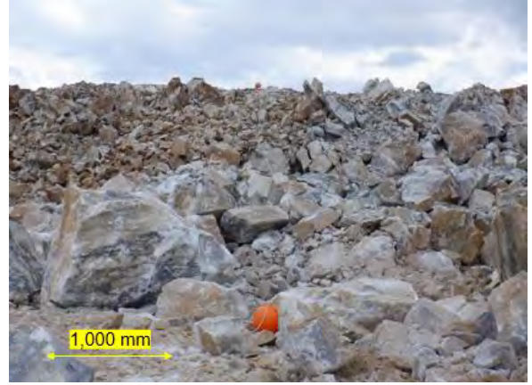
図1 婁下地区における大塊の発生状況

本研究対象である岩手県の大船渡鉱山では、これまで坂本沢地区および大平地区の2鉱区で石灰石の採掘を行ってきたが、2021年度より新たに婁下地区からの出鉱が開始された。図1に示すように、婁下地区では粒径800mmを超える起砕物(以下、大塊)が多く発生しており、発破後の小割発破や重機による小割作業が増大し、採掘コストの増大および大塊処理時の重機への負担が大きな問題となっている。そこで本研究では、現場試験を実施し起砕物粒度および起砕効果に及ぼす岩盤状態(岩石強度、岩盤内き裂)や発破規格の影響について種々検討し、婁下地区における発破状況の把握ならびに最適な発破設計指針構築のための基礎的な知見を得ることを目的とした。