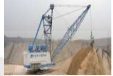
図1. ドラッグライン

石炭は、製鉄、火力発電など我々の生活の根幹を成す産業で幅広く使用されている。近年では世界的な人口増加、技術の発展に伴って、その需要量および生産量も急激な増加傾向にある。現在、世界の石炭量の40%が露天掘りで生産されているが、露天掘り石炭鉱山で最も作業量が多く、生産効率や生産コストに影響を及ぼす作業は剥土作業である。剥土岩石は、ドラッグラインやトラック&ショベルのような大型機械を用いて運搬されダンピングサイトに堆積される。ダンピングサイトとして利用可能な面積が限られており、また採掘終了後にリハビリテーションが行われることを考慮すると、効率的かつ安定なダンピングサイトを形成する必要がある。しかしながら、これまでダンピングサイトの設計に関する十分な研究は行われておらず、施工および設計に関する定量的な指針は確立されていない。そこで本研究では、ダンピングサイトの設計指針確立のための基礎的知見を得るために、各種諸条件がダンピングパイルの形状および形成に与える影響について、室内実験により種々検討を行った。