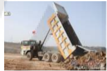
図2. トラック&ショベル